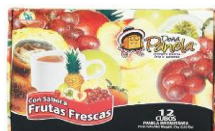
SUPER MINI 12 CUBOS