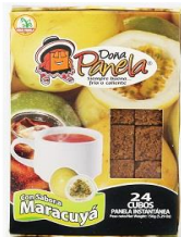
MINIDISPLAY 24 CUBOS