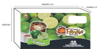
DISPLAY 48 CUBOS